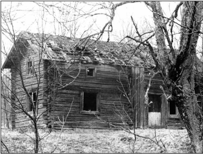
Torpet Snåret 2.

August och Oskar Larsson blev alltså de sista boende på Snåret 2. Förutom torpruinen finns det också kvar lämningar efter ladugårdsbyggnaden och en igenrasad jordkällare. Söder om torpet finns rester efter en smedja.